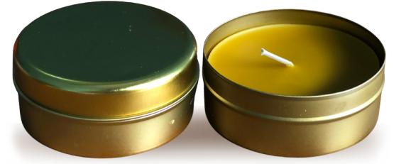
Balmumu Mum Gold Metal Kutuda