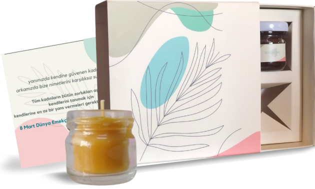
Balmumu Mum Seti

Ürünlerimizi mevsiminde üretiyoruz. Ürettiğimiz ürünler için mayıs ve kasım ayları arasında çalışabiliyoruz. Diğer aylarda da kadınlarımız çalışabilsin diye “Atölye” fikrimizi hayata geçirdik.