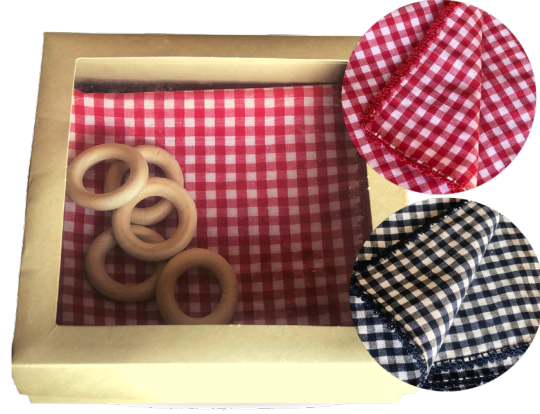
Kumaş Peçete Kenarı İşlemeli 6 lı – Kırmızı